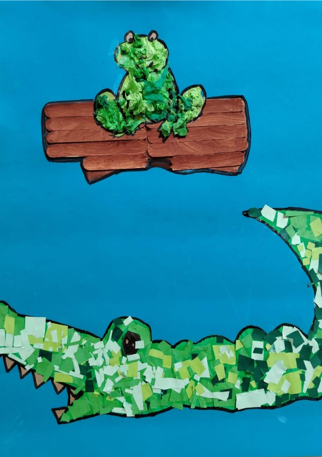
illustration de la partie 3 par la classe E